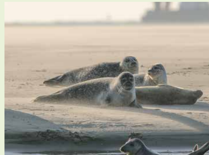
Groep rustende gewone zeehonden.