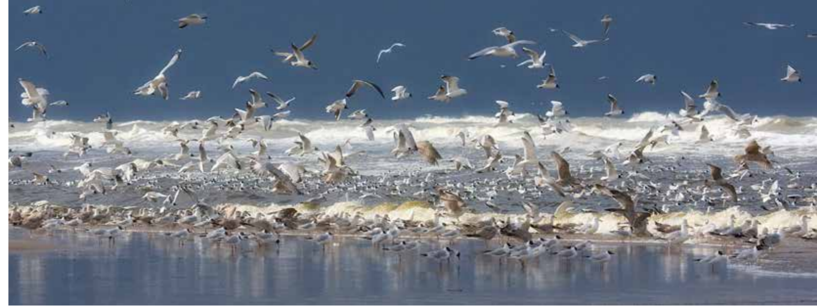
Meeuwen foerageren in de bruisende branding.

In het voorjaar strijken regelmatig groepen steltlopers als kanoet, drieteenstrandloper en bonte strandloper op de zandplaat neer. Om te snacken. Deze vogels hebben veel energie nodig voor hun lange trektochten naar het hoge noorden. De Razende Bol biedt ze naast voedsel ook rust. Rond het eiland kunnen tevens zwarte zeeëenden en jagende bruinvissen gezien worden.